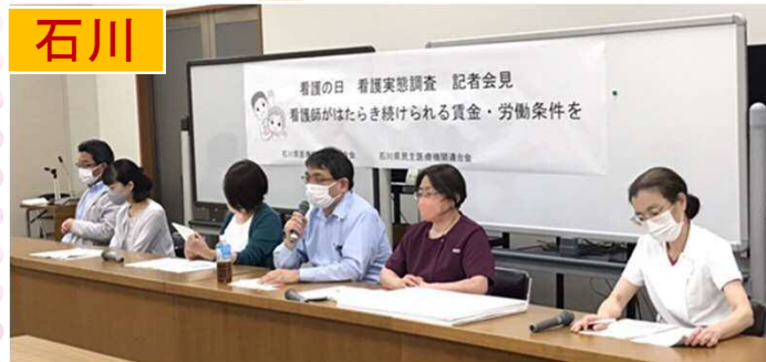
看護の日 看護実態調査 記者会見 看護師がたまたま続けられる賃金・労働条件を