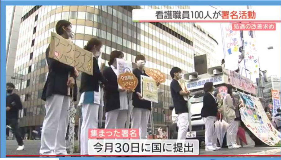
看護職員100人が署名活動